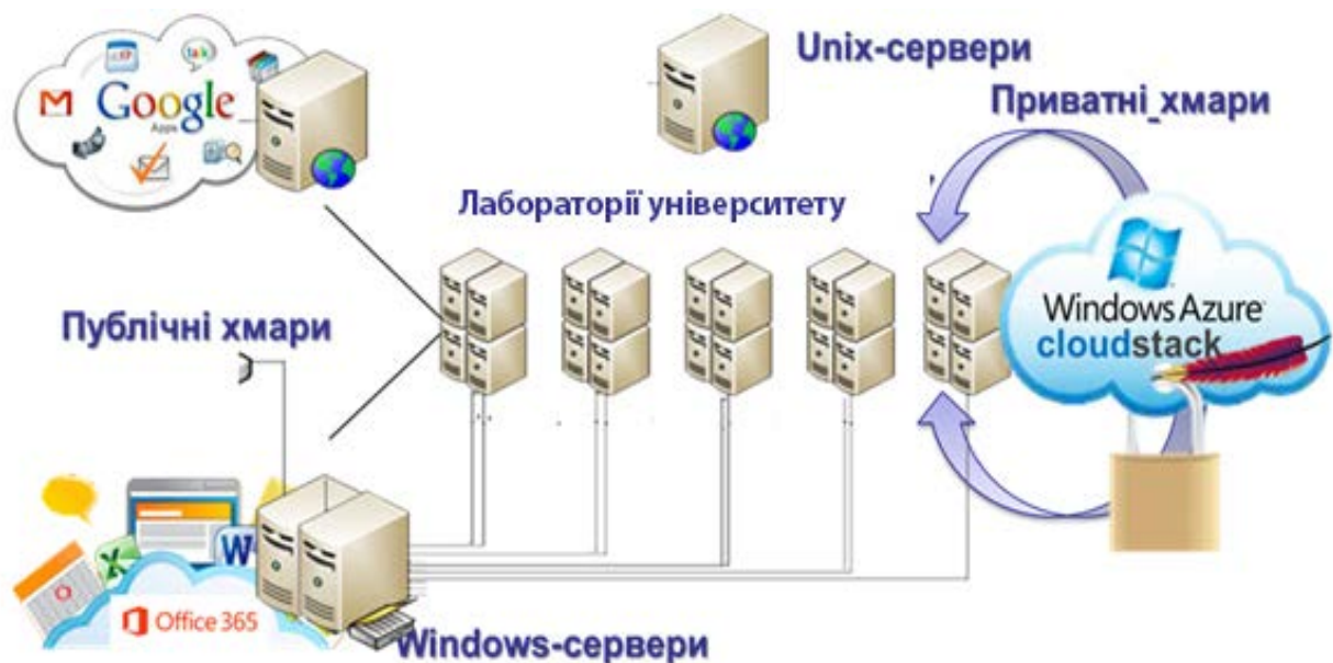
Рис. 2. Схема розгорнутої хмарної інфраструктури університету

Таким чином, модернізація технологічної компоненти стала основою та початком для створення інноваційного освітнього середовища університету через: